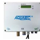
řídicí jednotka AQC Plus