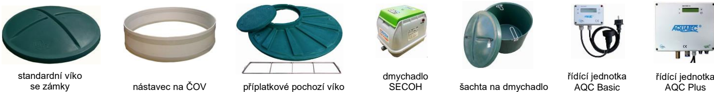
standardní víko se zámky

Firma Aquatec USBF s.r.o. si vyhrazuje právo na změnu výše uvedených cen.